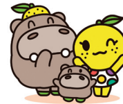
能美市 ひぼ能ん、ぼぼ能ん、ゆず美ん