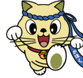
かほく市 にゃんたろう