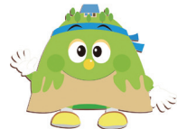
宝達志水町 ほっぴーさん