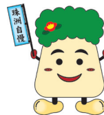
珠洲市 みつけたろう