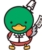
加賀市 健診カモンくん