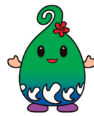
能登町 のっとりん