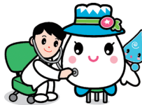
白山市 ゆきママとしずくちゃん