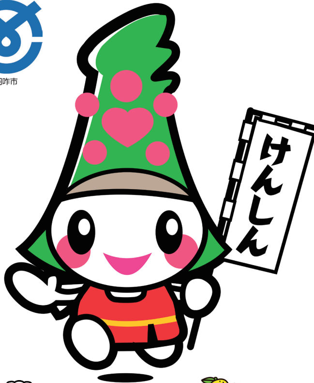
石川県 けんしんくん