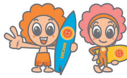
内灘町 ウッチーとナディ