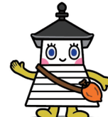
志賀町 西能登あかり