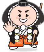
小松市 カプッキー