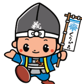
津幡町 よしなかくん